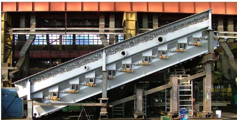
Fot. 1. Ruszt posuwisto-zwrotny firmy Keppel Seghers podczas testu hydrauliki

Problem zagospodarowania odpadów pojawił się w ubiegłym wieku na skutek wzrostu konsumpcji. Jednym ze sposobów utylizacji odpadów jest ich spalanie. Nie jest to jednak tylko zwykłe spalanie zanieczyszczające gazami otoczenie, z jakim czasem się spotykamy. Nowoczesne spalanie odpadów jest to całkowicie kontrolowany proces odbywający się przy bardzo wysokich temperaturach, z szybkością umożliwiającą redukcję szkodliwych substancji. Stosowany jako uzupełnienie procesu spalania, proces oczyszczania gazów wylotowych sprawia, że sposób ten zasługuje na miano całkowicie ekologicznego.