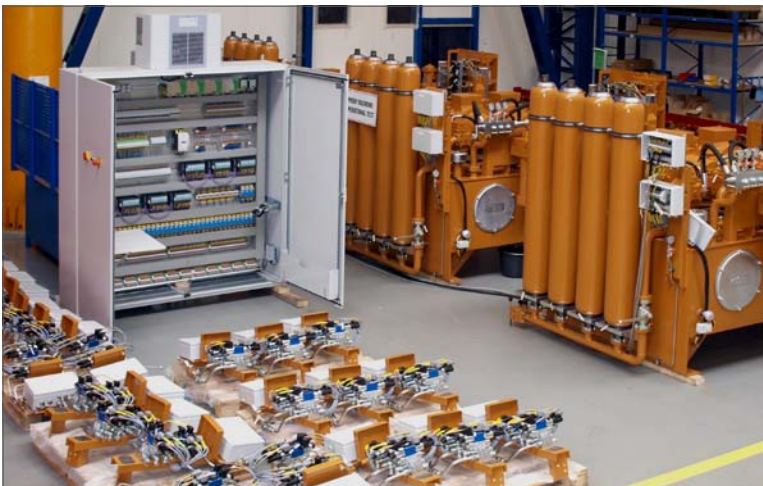
Fot. 3. Elementy napędu hydraulicznego rusztu: zasilacz hydrauliczny, szafa sterownicza, bloki zaworowe