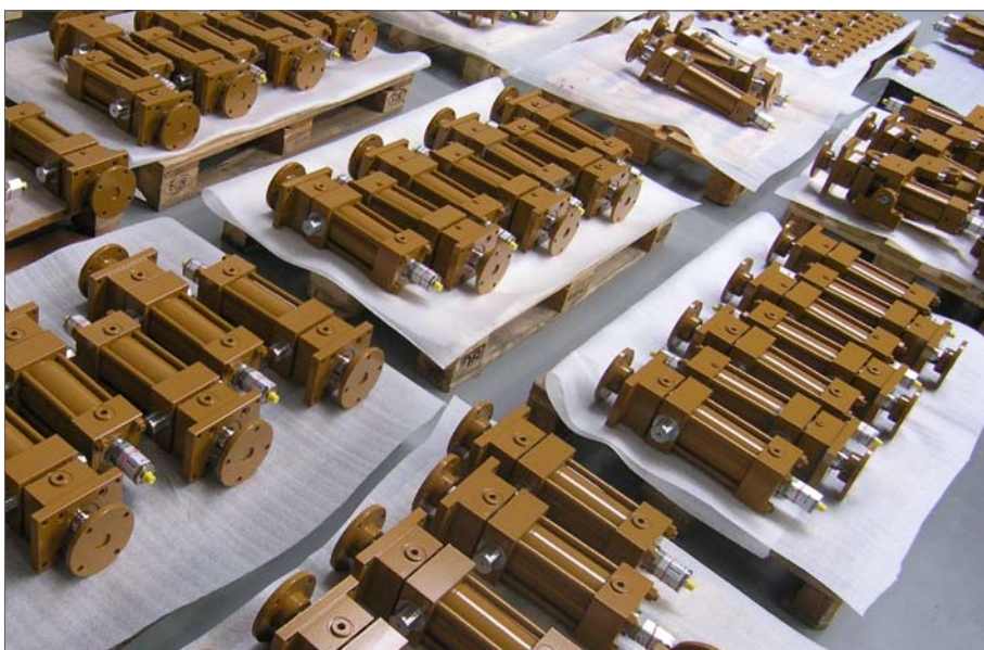
Fot. 2. Siłowniki segmentów rusztu

W procesie spalania odpadów uzyskujemy także energię elektryczną oraz ciepłą. W ten sposób zmienia się pojmowanie odpadów, nie jako śmieci, ale jako paliwa. Przy przerobieniu nawet do kilkuset ton paliwa dziennie uzyskuje się po kilkadziesiąt MW energii cieplnej oraz elektrycznej.